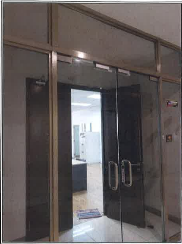
View of the entrance to the Property.